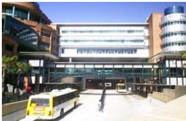
圖二 BRT 與聯合開發

雖然 BRT 有相對較低的建造與維護成本，但就如同地鐵輕軌等捷運系統，城市土地使用必須能夠配合公車捷運廊道重新檢討其規劃，適當調整土地使用強度，促使高密度發展，如此公車捷運系統可吸引較多乘客，增加業者收入，確保系統具有財務永續性。巴西庫里堤巴、哥倫比亞首府玻哥大以及澳洲布里斯本均有類似的具體策略，圖二即為布里斯本 BRT 車站聯合開發之現況。